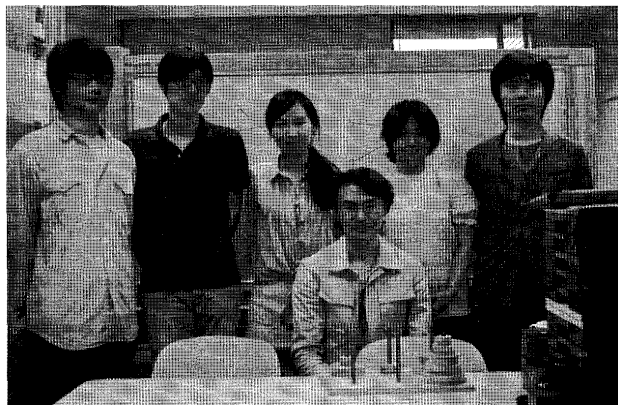
図1 三輪氏を囲んで

勉学に対して特に関心はなかった(むしろ嫌いだった!?)と語る氏であったが、高校は進学校に進み大学受験を迎えることになる。サイエンスに興味を抱いていた氏は、サイエンスの象徴である物理が学べる学部を目指すことにした。これまでどちらかという勉強に力を入れてこなかった氏であったが、最後の最後で追い込みをかけ、名古屋大学工学部応用物理学科に入学する。大学入学後、「大学」物理を勉強することになったが、「高校」物理とのあまりのギャップに挫折することになる。大学で学ぶ物理は数学によって現実世界の現象を記述するが、物理現象を表現した数式は高校時代の物理に比べるとあまりにも抽象的でリアルな世界を想像するのは難しかった。